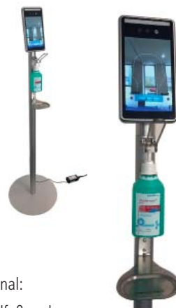
optional: Standfuß und Spenderaufnahme-Kit