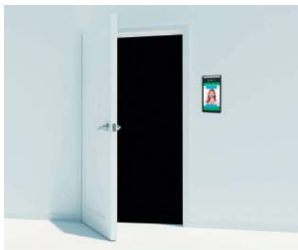
MBPC-K304-S001 mit Halterung-Kit für Wandmontage

Desinfektionsmittelflaschen Aufnahme für Standfuß