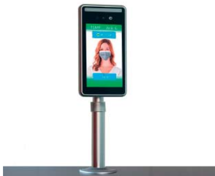
MBPC-K304-S002 mit Montagerohr für Desktop- oder Standfuß-Montage